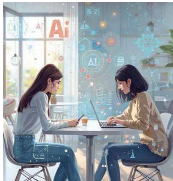
Bild mit KI generiert.